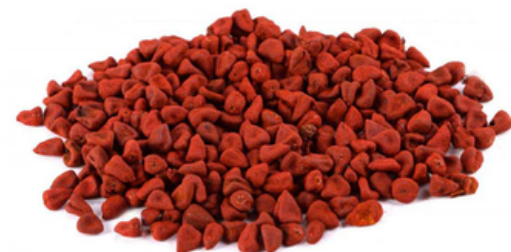
ACHIOTE 100 gramos: $10