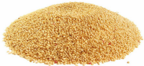
AMARANTO AMARILLO 1 lb.: $12