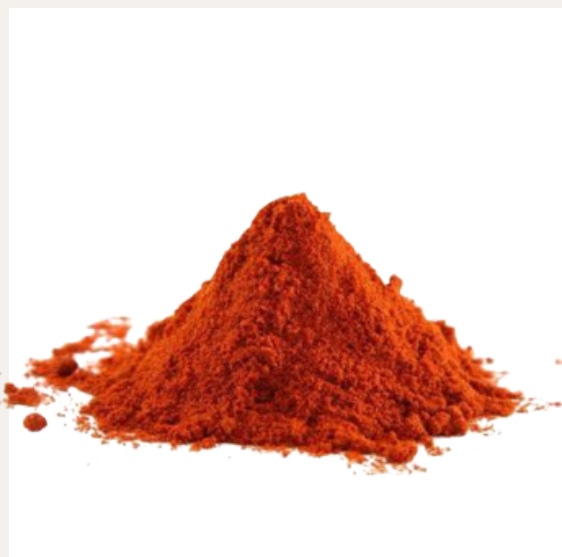
AJÍ PERUANO (en polvo) Ají limón: $10 (100 gr.) Ají rocoto: $10 (100 gr.)