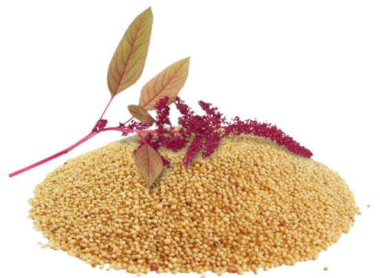
AMARANTO ROJO Semilla para brote:$10 (90 gr.)