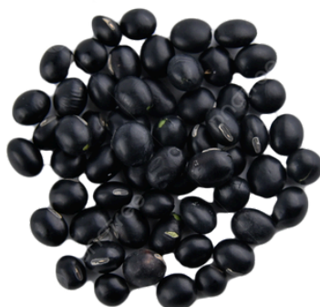
FRIJOL GANDUL En grano: $9 (1 lb.)